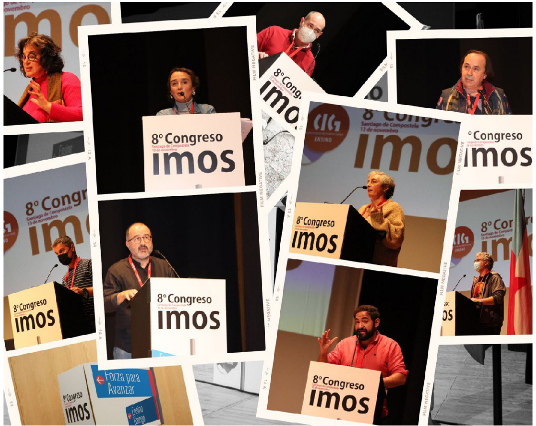
Executiva Nacional CIG-Ensino 8º Congreso